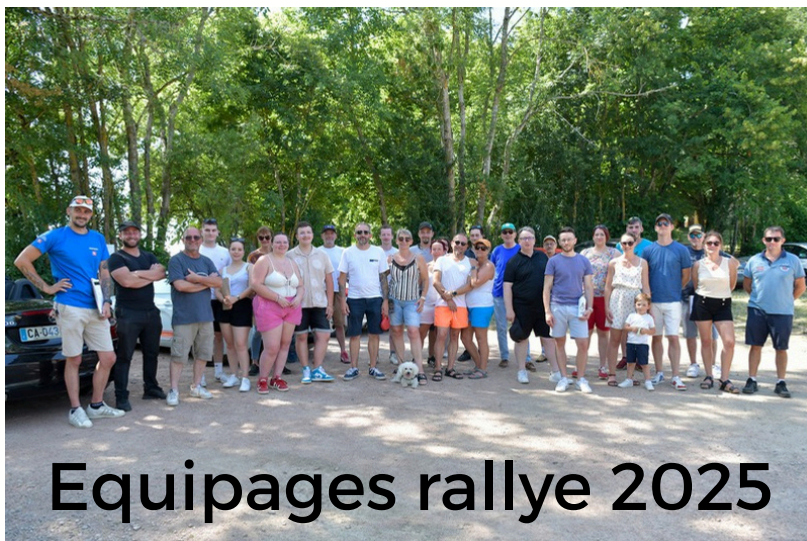
Equipages rallye 2025

sauvegardeterresbrennedandarge@gmail.com